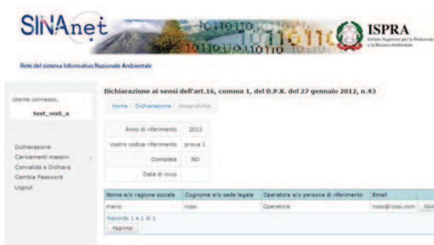
Figura 8. Compilazione della sezione "Anagrafiche" dopo l'inserimento dei dati dell' Operatore

Per inserire i dati della Persona di Riferimento è necessario cliccare su "Dichiarazione" e selezionare nuovamente "Anagrafiche" dal tasto "Opzioni". L'area di lavoro si presenta come in Figura 8.