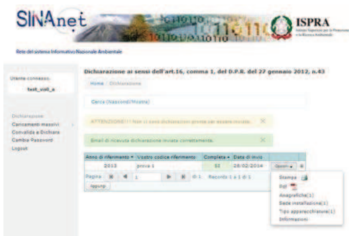
Figura 16. L'operazione di convalida e invio è avvenuta con successo

Trasmessa la dichiarazione, l'Utente può cliccare su “Opzioni” per: