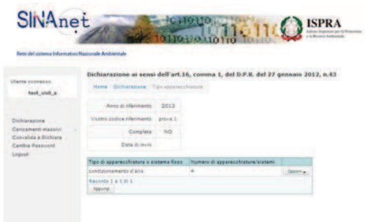
Figura 12. La sezione "Tipo Apparecchiature" dopo l'inserimento delle informazioni

Dopo la compilazione la sezione "Tipo Apparecchiature" appare per esempio come in Figura 12.