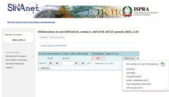
Figura 4. Le opzioni disponibili

Il tasto “Opzioni” (Figura 4) contiene un menu che permette all’Utente di eseguire diverse azioni: