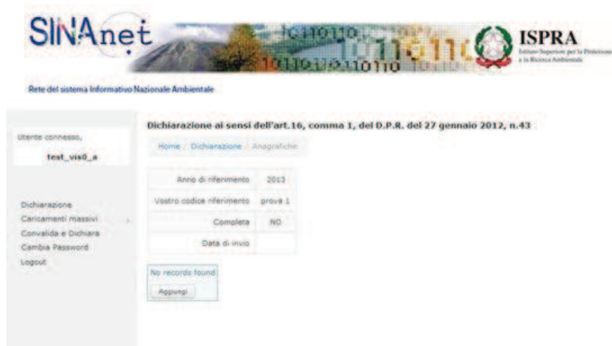
Figura 5. La sezione "Anagrafiche"

Selezionando "Anagrafiche" dal menu "Opzioni" l'Utente accede al modulo per la compilazione dei dati identificativi dell' Operatore e della Persona di Riferimento (Figura 5).