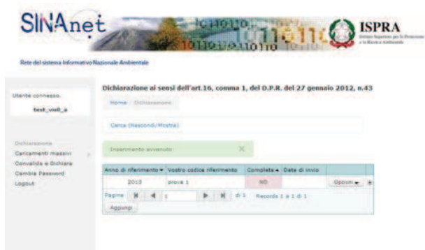
Figura 3. L’area di lavoro dopo aver inizializzato la dichiarazione.

L’area di lavoro si presenta adesso come nella Figura 3 di seguito riportata.