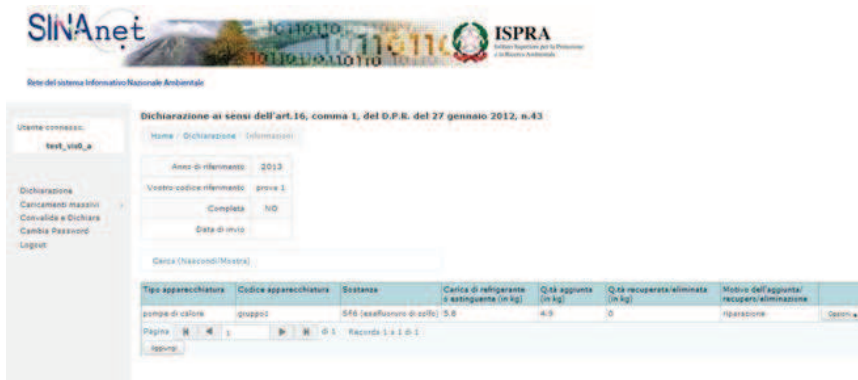
Figura 14. Riepilogo della sezione “Informazioni” dopo l’inserimento dei dati

Ritornando su “Dichiarazione”, e selezionando da “Opzioni” la voce “Informazioni”, l'Utente può proseguire l'inserimento dei dati in questa sezione. Premendo “Aggiungi” nel riepilogo, l'Utente può inserire le informazioni relative a gas e quantità delle altre tipologie di apparecchiature (Figura 14).