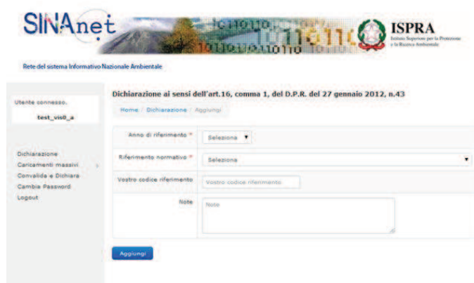
Figura 2. Inizializzazione di una dichiarazione