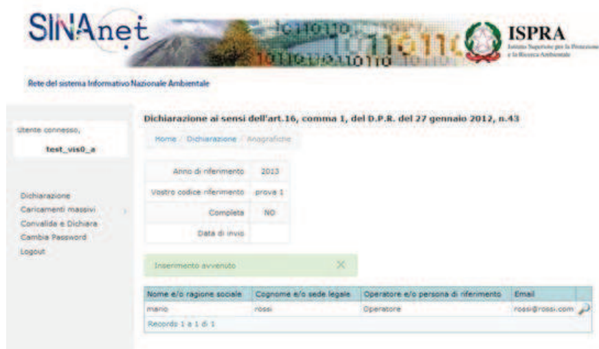
Figura 7. L'area di lavoro dopo l'inserimento dei dati dell' Operatore

L'area di lavoro, dopo l'inserimento dei dati dell' Operatore appare come in Figura 7.