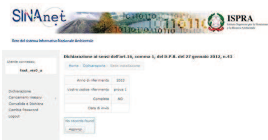
Figura 9. Per inserire i dati identificativi della sede di installazione

Premendo nuovamente su “Dichiarazione” e selezionando “Sede di Installazione” dal tasto “Opzioni” l’Utente accede alla compilazione dei dati identificativi della sede di installazione (Figura 9).