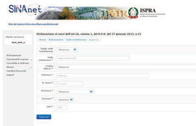
Figura 10. L’inserimento dei dati identificativi della sede di installazione

ATTENZIONE!!! La funzione ‘Scegli sede di installazione’ permette di richiamare i dati già inseriti precedentemente facilitando così la compilazione della sezione.