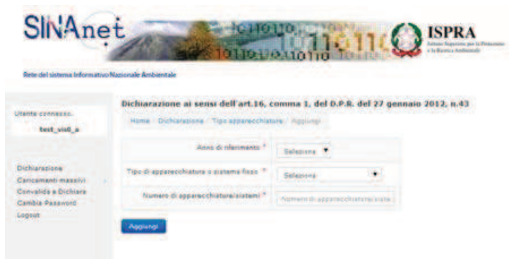
Figura 11. La sezione "Tipo Apparecchiature"

Premendo nuovamente su "Dichiarazione" e selezionando "Tipo Apparecchiature" dal tasto "Opzioni" l'Utente può inserire la tipologia delle apparecchiature presenti e il relativo numero (Figura 11). Anche questa sezione è OBBLIGATORIA .