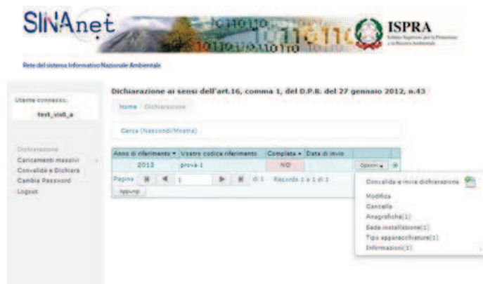
Figura 15. Riepilogo dati inseriti

È stata così completata una dichiarazione. Premendo su “Dichiarazione” il sistema visualizza la lista dei documenti inseriti per l'anno corrente (Figura 15). Cliccando su “Opzioni” il sistema evidenzia ora il numero di record inseriti nelle sezioni “Anagrafiche”, “Sede di installazione”, “Tipo Apparecchiature” e “Informazioni”.