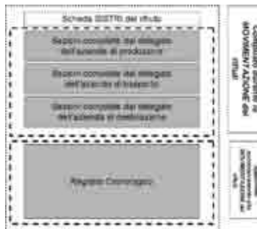
FIG. 3 SCHEMATIZZAZIONE GENERALE SCHEDA SISTRI

Le schede SISTRI presenti nell’Allegato III del Decreto sono le seguenti: